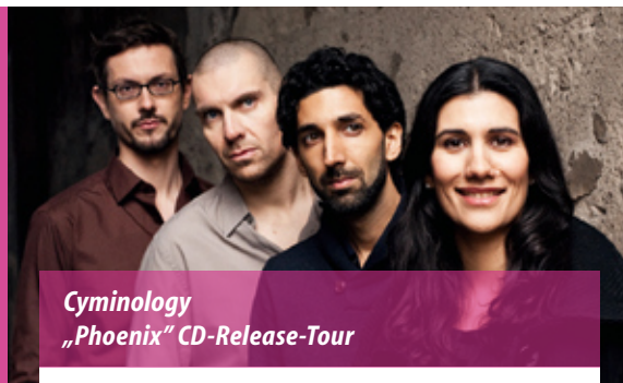
Cyminology „Phoenix“ CD-Release-Tour